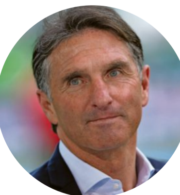
Ein Mann der Bundesliga: Bruno Labbadia

Das Gute an Labbadia ist und bleibt: Wer ihn verpflichtet, bekommt nichts Überraschendes, sondern etwas Verlässli-